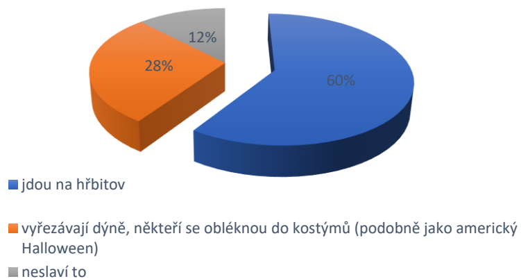
Jak slavíte Památku zesnulých?

Rozhodli jsme se vytvořit anketu mezi žáky na téma oslavy Památky zesnulých. Zeptali jsme se celkem čtyřiceti osmi žáků, jakým způsobem tento svátek slaví. Jejich odpovědi jsme pro vás zanesli do grafu. Odpovídali žáci 2. stupně naší školy.